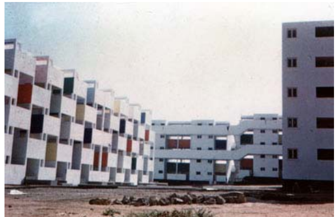
Carrières Centrales – logement collectif (cités verticales nid d'Abeilles et Sémiramis – par Atbat Afrique)

Michel Ecochard est décédé en mai 1985, à l'âge de 80 ans, non sans avoir publié un dernier écrit : "Politiques urbaines dans le Monde Arabe" (colloque tenu en novembre 1982 à la Maison de l'Orient Méditerranée à Lyon).