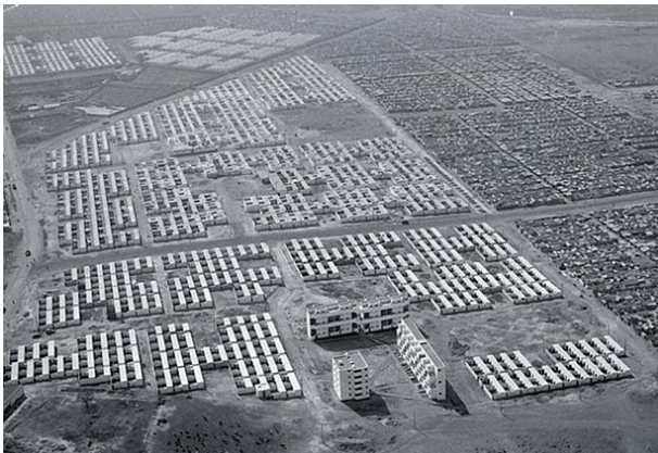
vue aérienne des Carrière Centrale : la trame 8mx8m